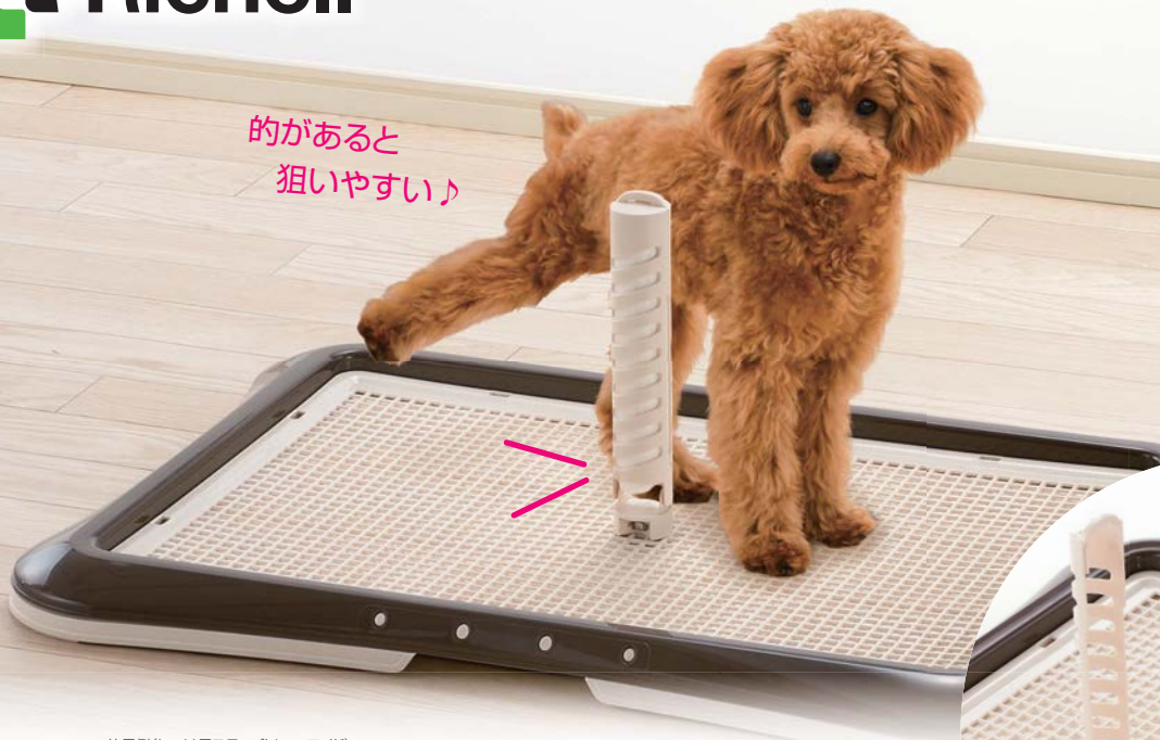
使用例(しつけ用ステップレー ワイド)