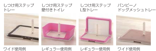
ワイド使用例 レギュラー使用例 レギュラー使用例 ワイド使用例