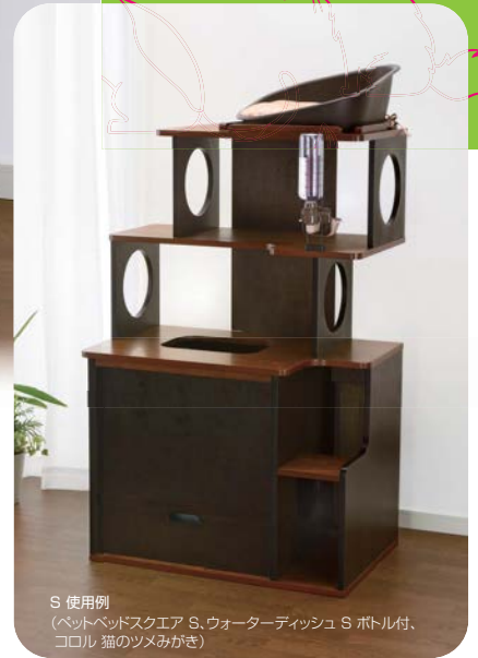
S 使用例 (ペットベッドスクエア S、ウォーターディッシュ S ボトル付、コロール 猫のツメみがき)