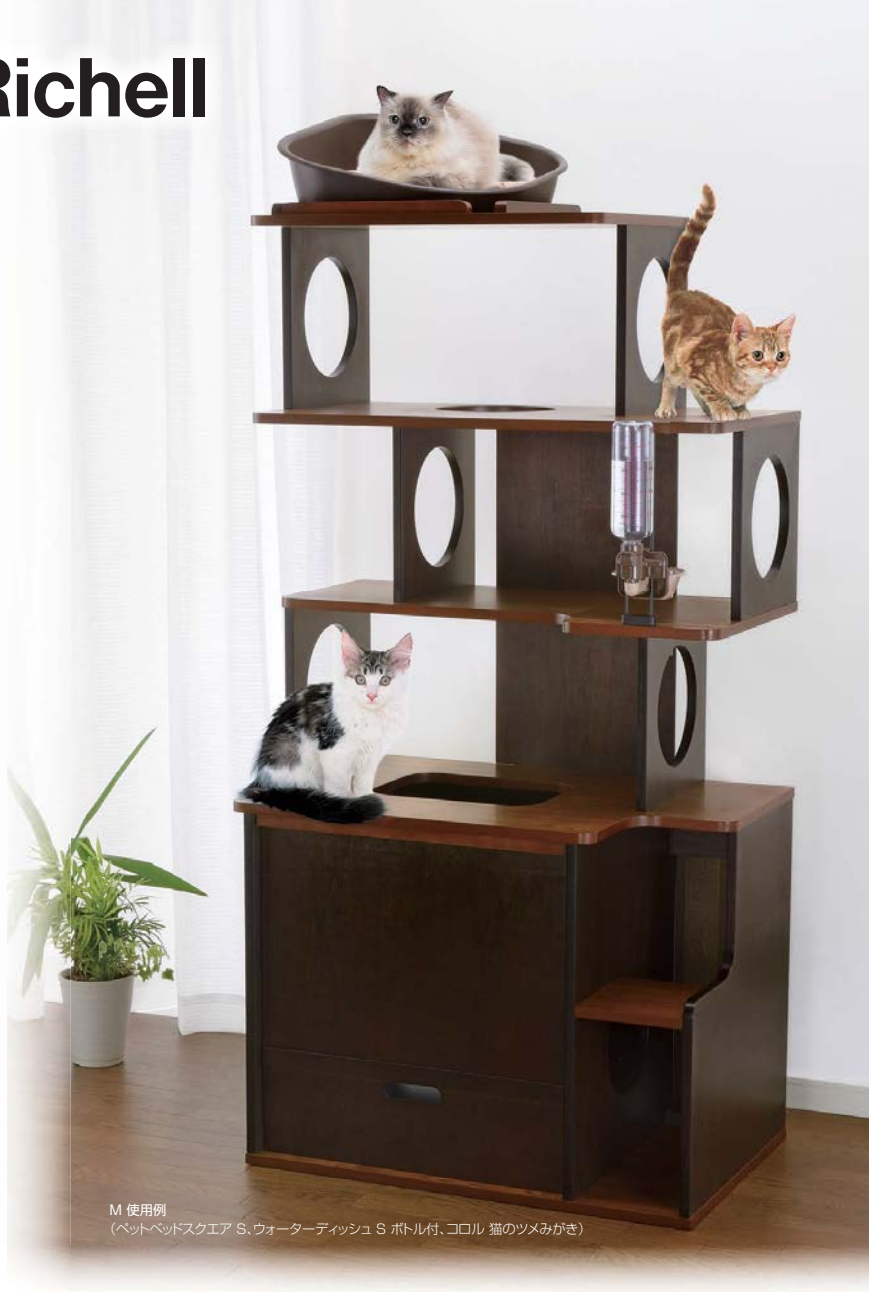
M 使用例 (ペットベッドスクエア S、ウォーターディッシュ S ボトル付、コロール 猫のツメみがき)