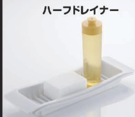
ハーフドレイナー