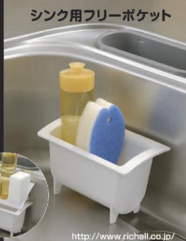
シンク用フリーポケット