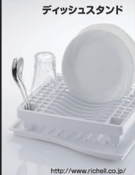
ディッシュスタンド