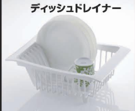
ディッシュドレイナー