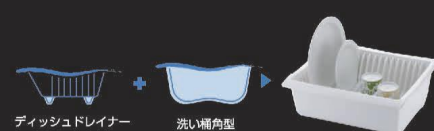
ディッシュドレイナー 洗い桶角型