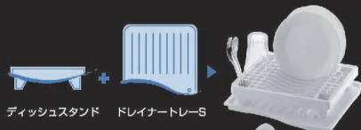
ディッシュスタンド ドレイントレーS