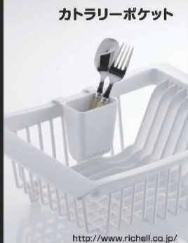
カトラリーポケット