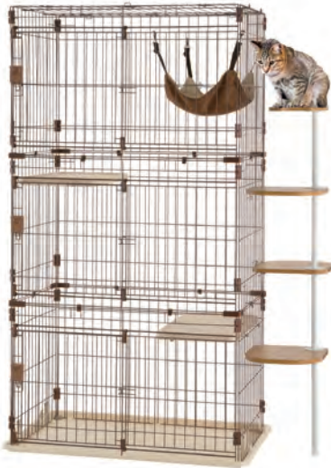
4段、リラクスキットサークルM 組み合わせ使用例