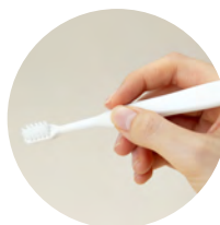
ペンシルグリップしやすい 三角形の柄