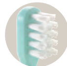
すき間にしっかり届く2段ブラシ