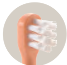
すき間にしっかり届く2段ブラシ