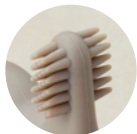
両面ソフトブラシ