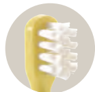
すき間にしっかり届く2段ブラシ