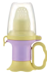
ライトバイオレット